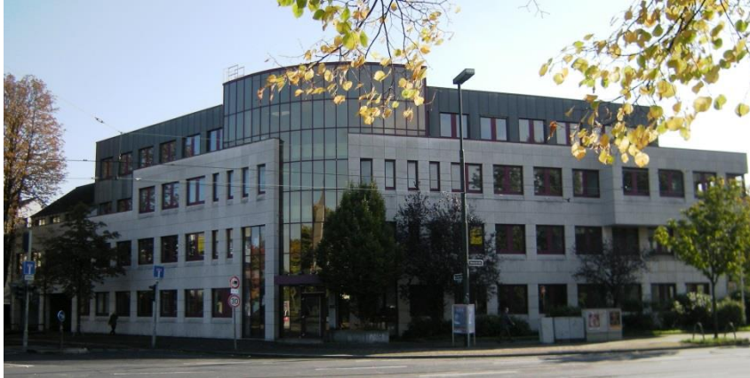
Amt für Verbraucherschutz